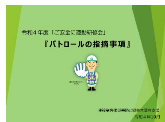
(写真1) 研修会用テキスト