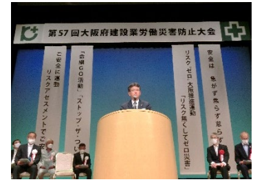
(写真 6)「第 57 回大阪府建設業労働災害防止大会」風景

第 1 部で行った支部表彰規程に基づく安全表彰の該当者は、功労賞 10 名、功績賞 31 名、優良賞会社 5 社、優良賞現場 50 現場である。新型コロナウイルス感染症対策を徹底し、規模を縮小して開催した。