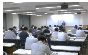
(写真5)「わかりやすい施工計画作成の着眼点」講習会風景