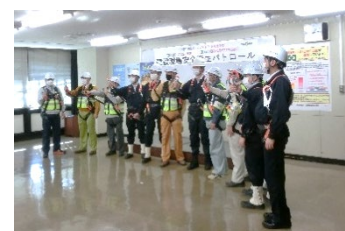
(写真3) 「ご安全に運動パトロール」出発式風景