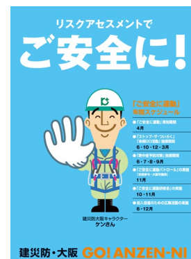
(写真 2) 「ご安全に運動」ポスター

「リスクアセスメントでご安全に！」のスローガンのもと平成 22 年度より年間を通じての運動と位置づけ、強調期間を設けて次の活動を実施した。分会の安全パトロールでは、「ご安全に運動」実施要領や「ストップ・ザ・ついで」リーフレットを配布するとともに、安全指導者がフルハーネス型安全帯の使用を呼び掛けた。また、全会員に「ご安全に運動」ポスター（写真 2）を送付し、運動の周知並びに推進に努めた。