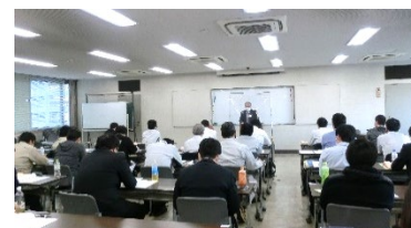
（写真5）「わかりやすい施工計画作成の着眼点」講習会風景