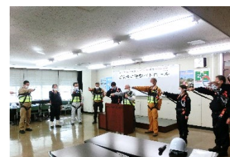
(写真 3) 「ご安全に運動パトロール」出発式風景

令和 3 年度参与テキスト部会が作成した資料をもとに、「なくそう 墜落災害・重機災害」をテーマとした「ご安全に運動研修会」を 12 分会において開催し、合計 881 名が受講した。なお、茨木分会では新型コ