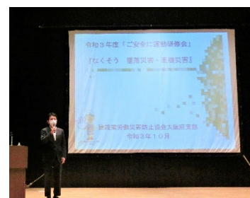
(写真 4) 「ご安全に運動研修会」風景