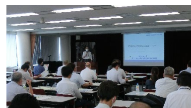
（写真6）「石綿障害予防規則等の法改正」説明会風景