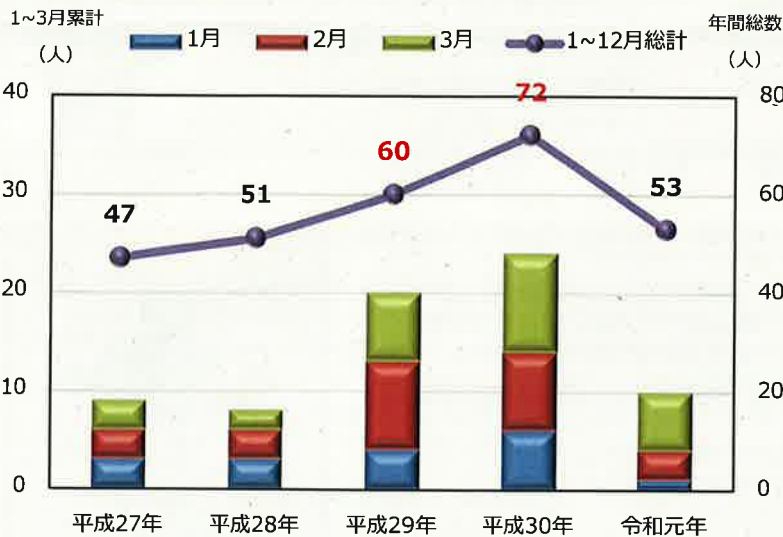
冬季における死亡災害が全体に占める状況

各事業場においては、事業者、労働者が協力して、墜落災害並びに交通死亡災害を防止しましょう。