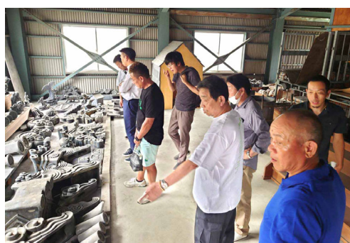
(株)タツミ鬼瓦製造工場