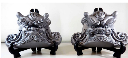
新後のみやげ購入品