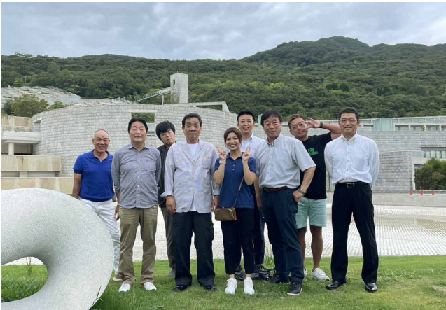
兵庫県立淡路夢舞台・国際会議場・百段苑(安藤忠雄作)