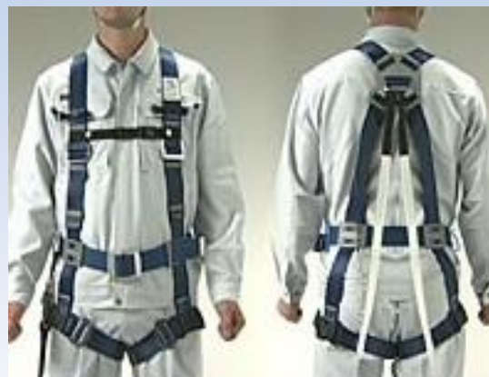
フルハーネス型墜落制止用器具