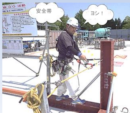
試行ゲートで点検と訓練