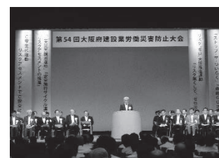
(写真 7) 安全大会の開催

第 1 部で行った支部表彰規程に基づく安全表彰の該当者は、功労賞 6 名、功績賞 34 名、優良賞会社 5 社、優良賞現場 57 現場である。