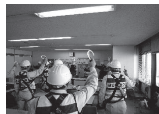
(写真 3) 「ご安全に運動パトロール」出発式風景